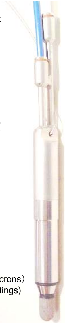
Blatypus Mini Pump (227mm x 21.84mm)

製品の詳細については、下記電話番号もしくは ssasaki@besstinc.com まで連絡してください