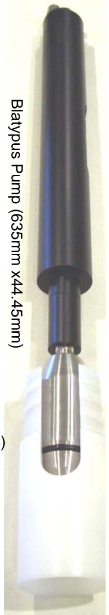
Blatypus Pump (635mm x 44.45mm)

製品の詳細については、下記電話番号もしくは ssasaki@besstinc.com まで連絡してください